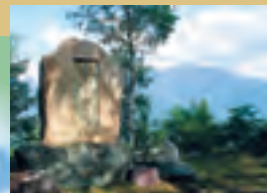
鹿嶺高原開発経緯記念碑