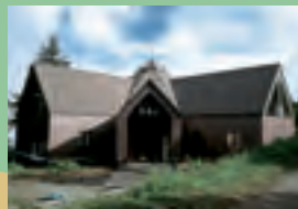
鹿嶺高原の中心、雷鳥荘