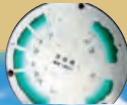
展望台から見える山並みを示す方位盤