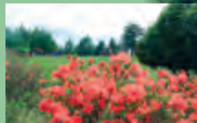
れんげつじの咲くキャンプサイト

鹿嶺高原は大展望地。遊歩道各所や2箇所設けられた展望台から雪をいただく南・中央・北の各アルプスの峰々、伊那市街の夕景と満点の星空など、胸のすく眺めが得られる。また、遊歩道沿いは花の宝庫。初夏から秋にかけてマイヅルソウ、ペニバナイチヤクソウなどをはじめ多くの亜高山帯の花々が咲く。