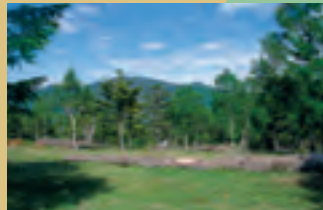
樹林の美しい北星平