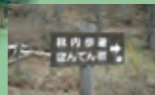
ぼんてん岩遊歩道