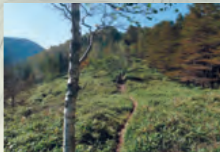
入笠山～鹿嶺高原 トレッキングコース

鹿嶺高原キャンプ場 長野県伊那市長谷非持三八一七の二 電話 0265(48)2701