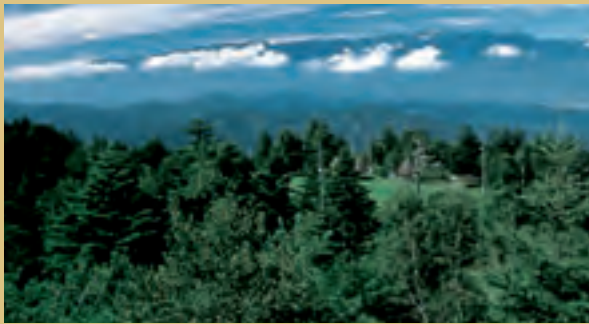
展望台から遠望する中央アルプスの山並み。右から西駒ヶ岳から空木岳、南駒ヶ岳とつづく。前景樹林内にキャンプ場がある。

アルプスの峰々と満天の星が輝くハイランド 眼前にたおやかな仙丈ヶ岳と鋭くそびえる東駒ヶ岳や鋸岳、そして中央、北アルプスが一望できる「アルプスの大展望台」。伊那市役所長谷総合支所から12km、標高1800mの高原は真夏でも18℃の快適さ。キャンプサイトや宿泊施設が完備された屈指の山岳リゾート地。