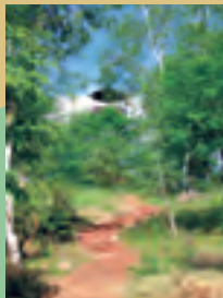
360度の景観が得られる展望台へ

高原の北側は北星平といわれ、針葉樹のコメツガやウラジロモミに囲まれたテントサイトになっていて、炊事場やトイレが点在する。宿泊施設雷鳥荘までの遊歩道は森林浴が楽しめる。