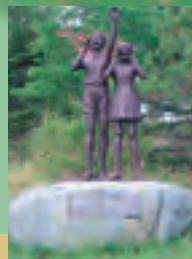
鹿嶺高原の入り口に立つ、やまびこ銅像